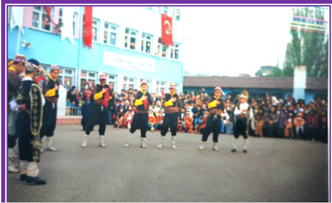
Osman Hamdi Bey Ortaokulu 1985