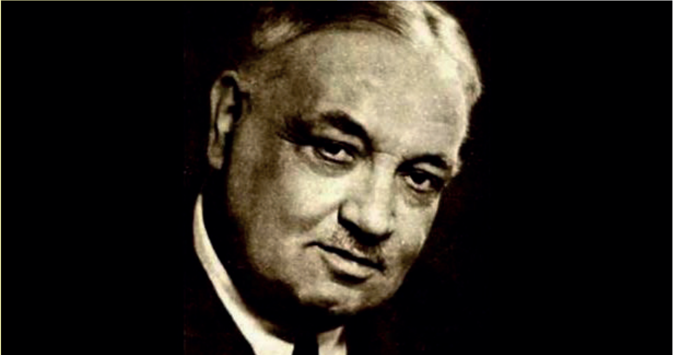
Yahya Kemal BEYATLI

İkinci beyitte, bu geminin sessiz olmasına dikkat çeken şair, insanların bu dünyadaki yalnızlığını bu şekilde ifade etmiştir. Ayrıca burada bir tezat da söz konusudur. Hiç bir gemi hareket ederken sessiz olur mu? İşte burada tezat sanatını kullanarak aslında gürültü çıkarması gereken geminin sessiz olduğunu ifade etmiştir. Etraftaki insanlar yardım edebilir ancak bu her zaman böyle olmamaktadır. Yani her insan kendi içinde bir dünyadır ve o dünyada, her ne kadar etrafında insanlar olsa da tek başına yaşamaktadır. Çünkü mendil ve kol sallanmaz diyerek şair mendil ve onu tutan bir kolun yani insanların var olduğunu fakat sessiz kaldıklarını, yardımcı olmadıklarını ifade etmektedir.